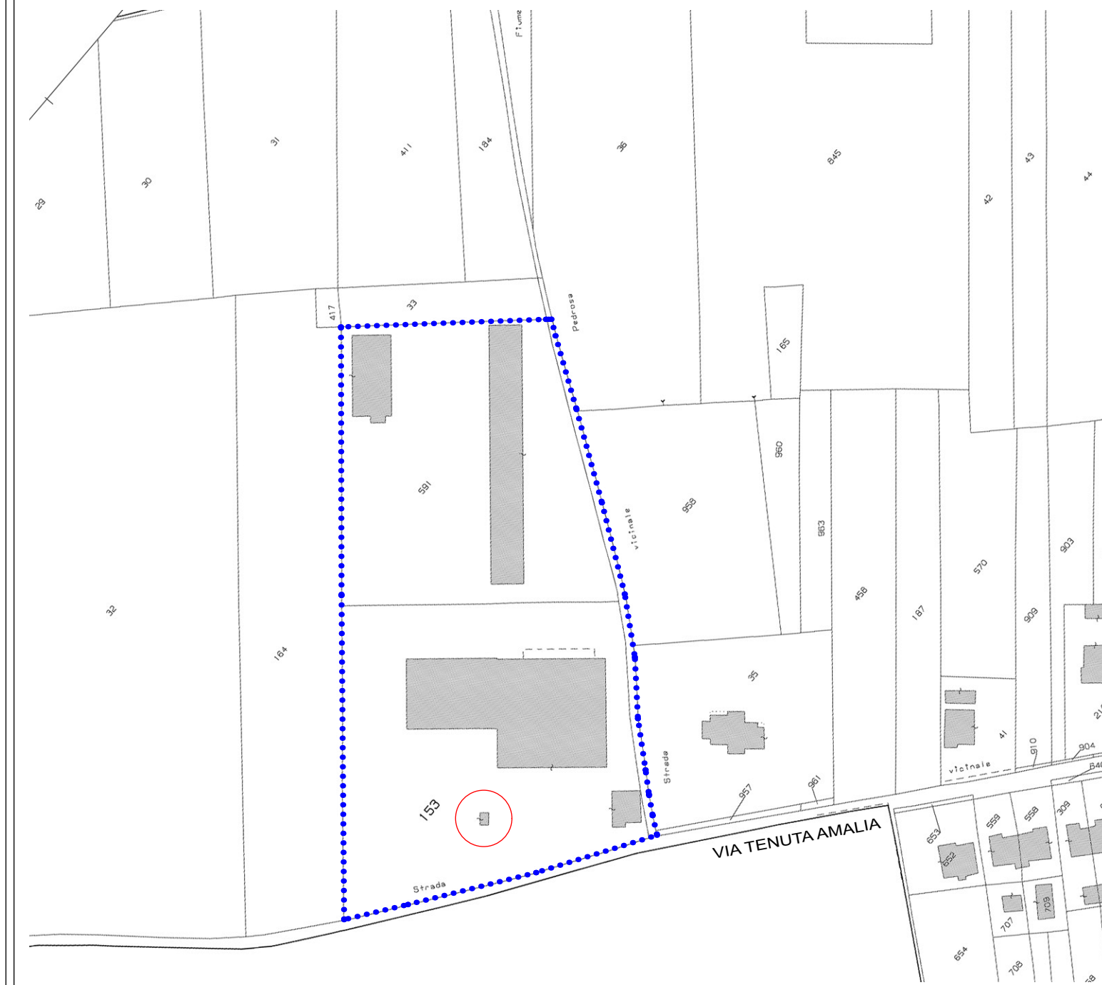
Comune di Verucchio planimetria scala 1 : 2000 foglio 6 - mappali 153