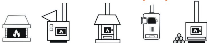
CAMINETTI APERTI, CAMINI CHIUSI, STUFE, INSERTI E CUCINE A LEGNA O PELLETT, CALDAIE ALIMENTATE A PELLETT O CIPPATO